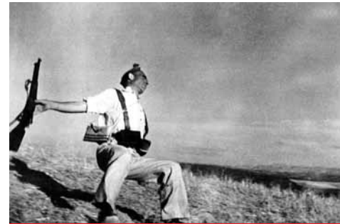
R. Capa. Mort d'un soldat républicain