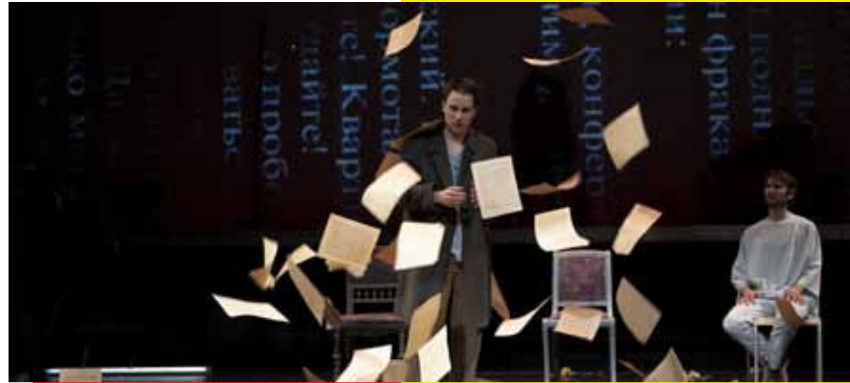
Le Maître et Margeurite

https://www.theatresaintmaur.com/saison/spectacles/theatre.htm